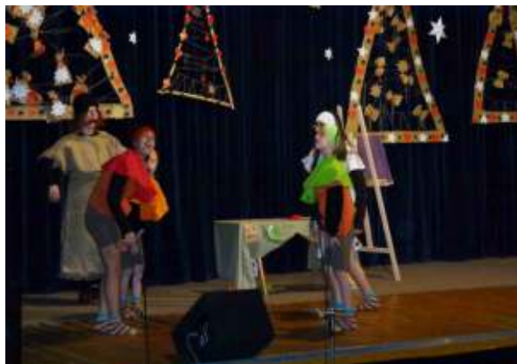
Vystúpenie divadelného krúžku na vlašajšom festivale Napočka

nemohli sme nenaštvíť miesto, kde je stred Európy. Bolo zaujímavé stáť presne v strede Európy. Všetci sme sa od fotili, nabrali energiu, aby sme mohli pokračovať v práci. Tiež sme navštívili Kresťanské centrum pre nepočujúcich v Lúčkach pri Kremnici. Práve oslavovali jeho výročie spojené s odhalením sochy a požehnaním svojho patróna sv. Filipa Smaldone.